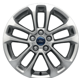
Колісні диски легкосплавні, шини 225/65 R17 (Titanium, Business)