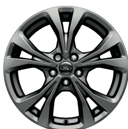
Колісні диски легкосплавні, шини 225/60 R18 (ST-Line, ST-Line X)